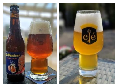
« La Madeleine » « La 4° Clé »

Pour accompagner vos bières, pourquoi pas une portion de salami et fromage ? – 9,50€