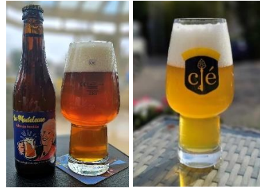
« La Madeleine » « La 4 e Clé »