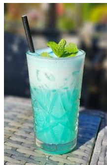
Cocktail « Vert d'Eau »