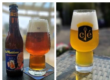
« La Madeleine » « La 4° Clé »